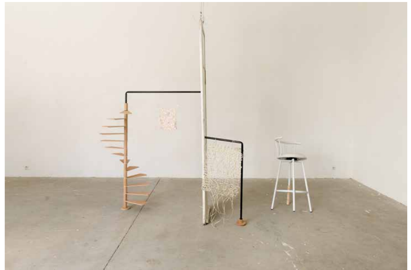
Sans titre , 2014 Porte glanée, tabouret glané, bois, câbles électriques, porcelaine, tubes. 60x200x170 cm