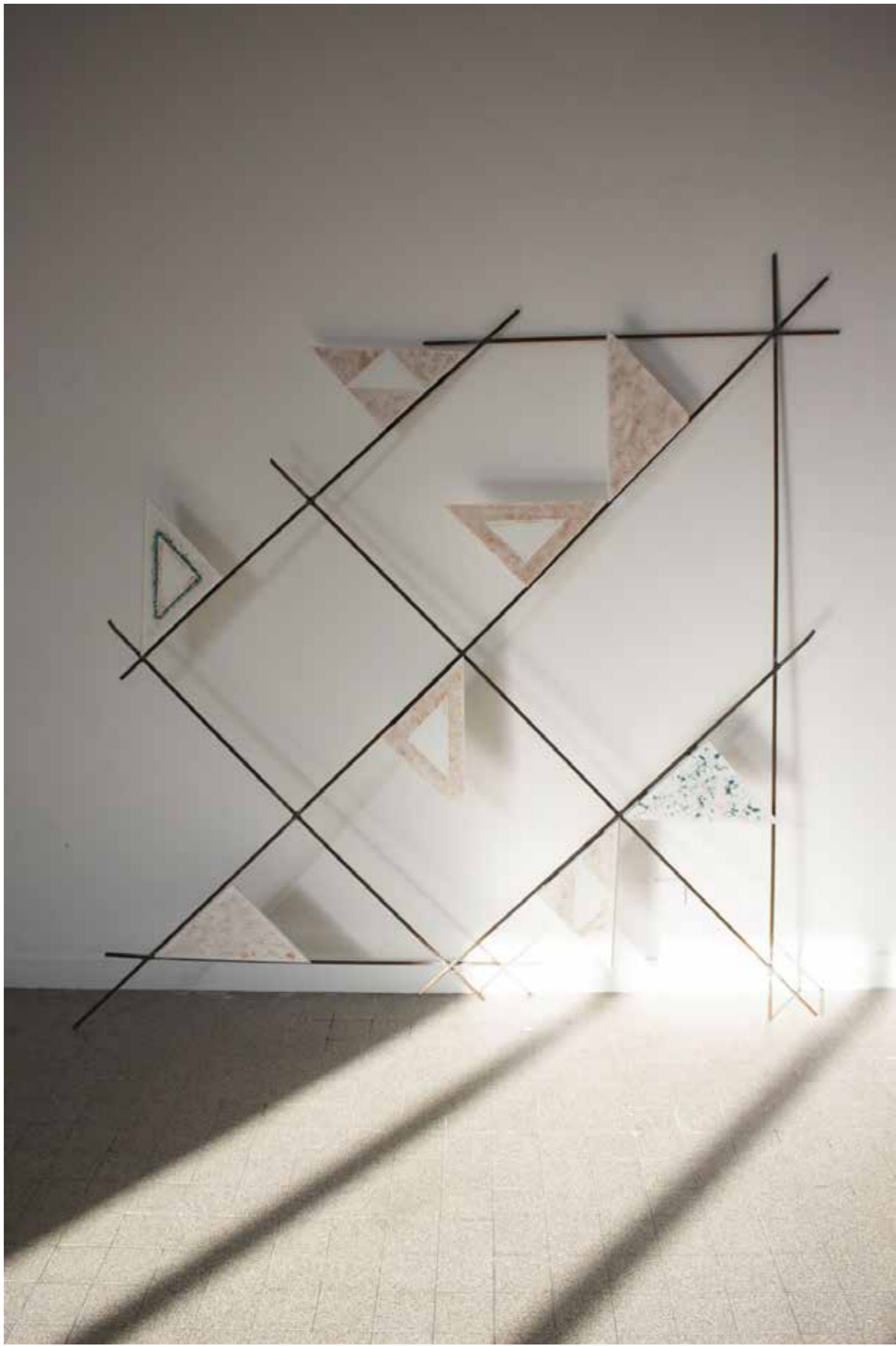
Triangles minéraux 2 , 2017 peinture, pigment et argile crûe sur bois, fers à béton 200 x 200 cm