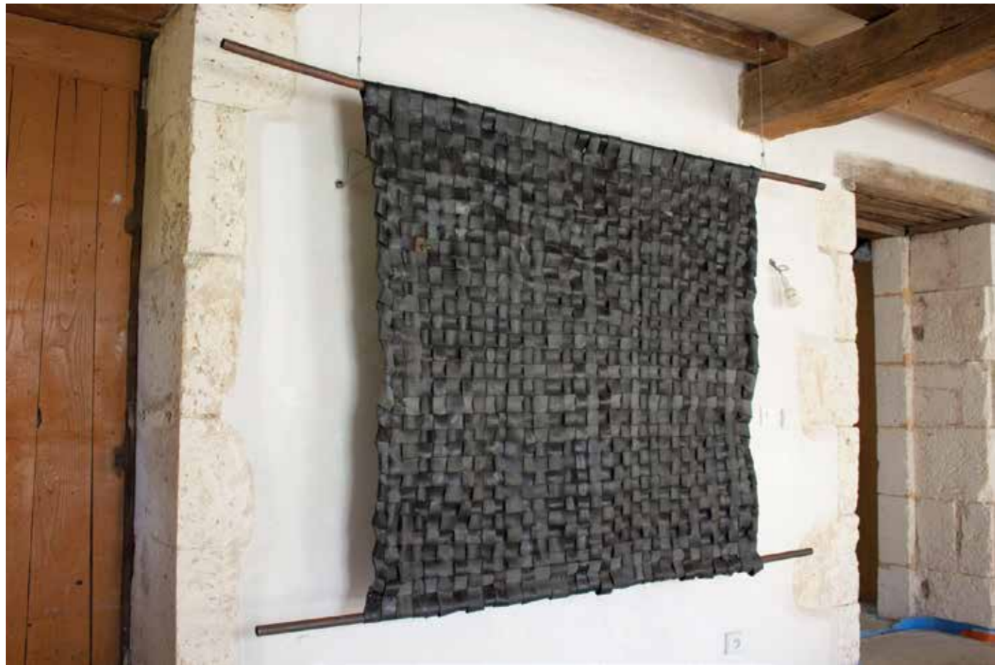
Trame et aspérités , 2018 caoutchouc, tubes en métal, ficelle. 200 x 144 cm