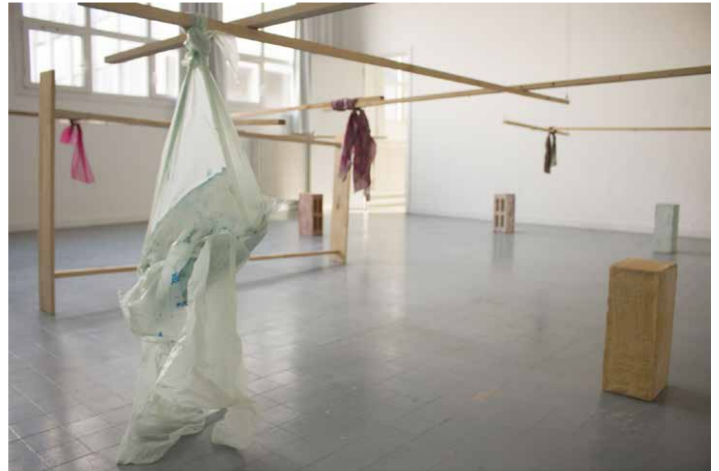
Passerelles et garrots , 2016/2017 parpaings en béton teinté dans la masse, tasseaux de bois, tissus, plâtre. Dimensions variables