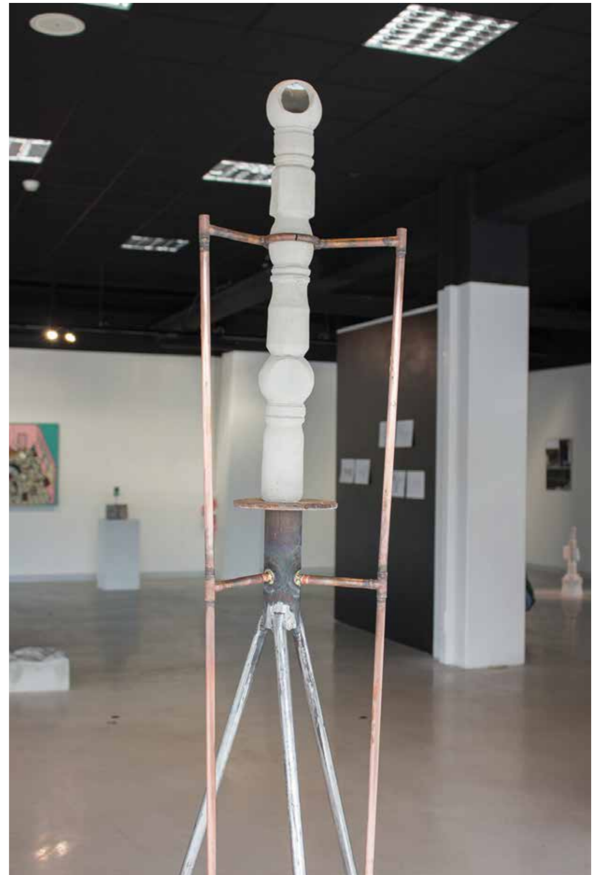
Périscope , 2017 Argile crûe, acier, cuivre, miroirs 170 x 50 x 50 cm Exposition Double Bande , Les Abords, Brest