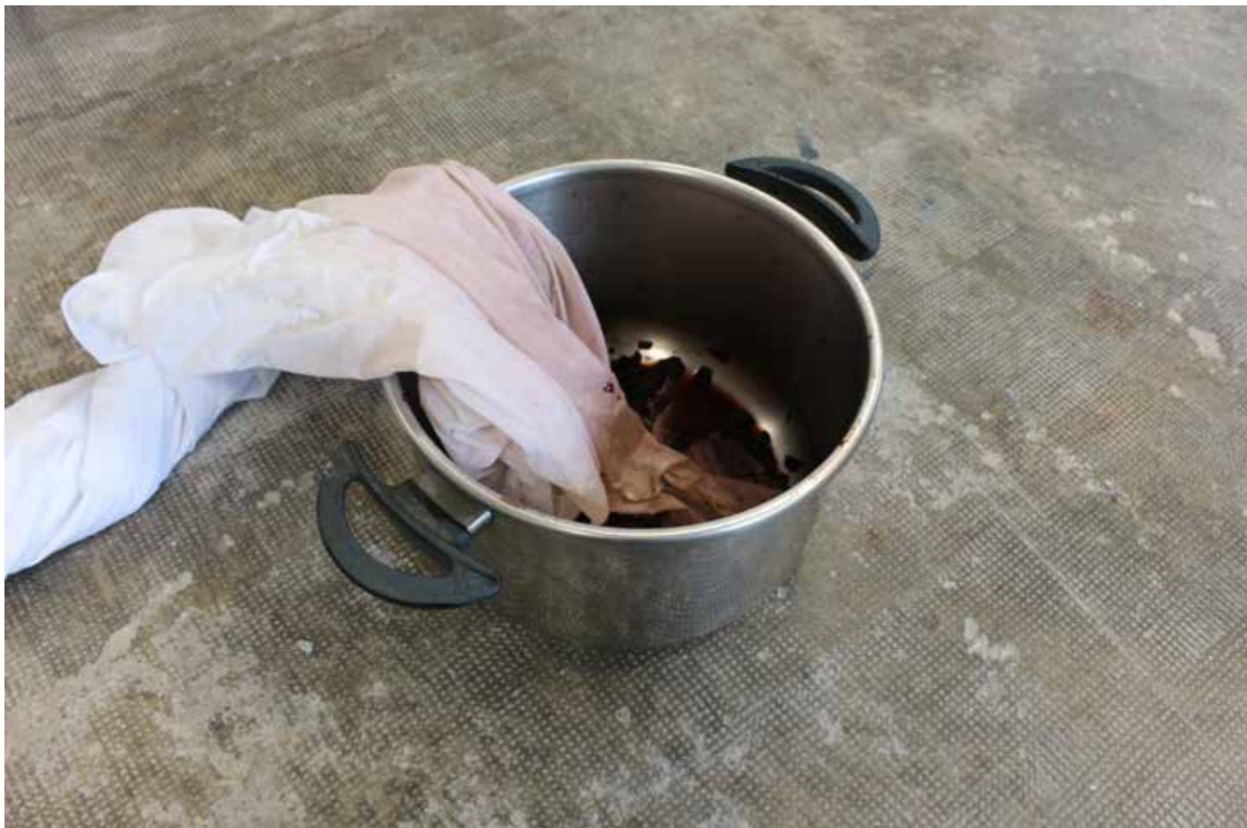
Installation expérimentale, 2020

Les recherches menées devraient se nourrir d'éléments scientifiques du site. Je tends actuellement mes recherches dans mon travail vers un emprunt au vocabulaire de la science «ludique», comme du matériel utilisé et des gestes effectués en chimie ou bien des dessins schématiques d'un montage pour une expérience.