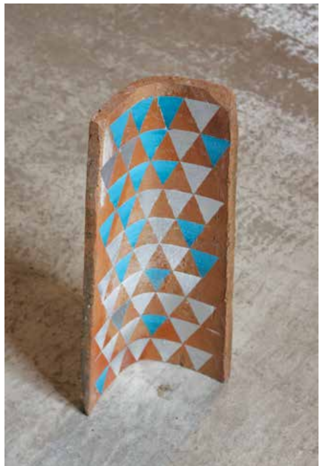
C'est glissant et poreux , 2018

Tuile en terre cuite, peinture acrylique et aérosole. 50x23x7 cm.